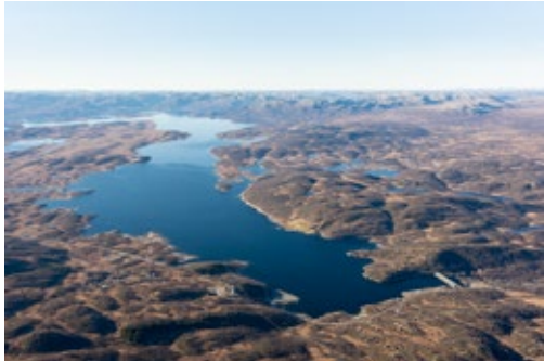
Møsvatn – hovedvannkilden for kraftverkene i verdensarvområdet. Dammen til høyre.