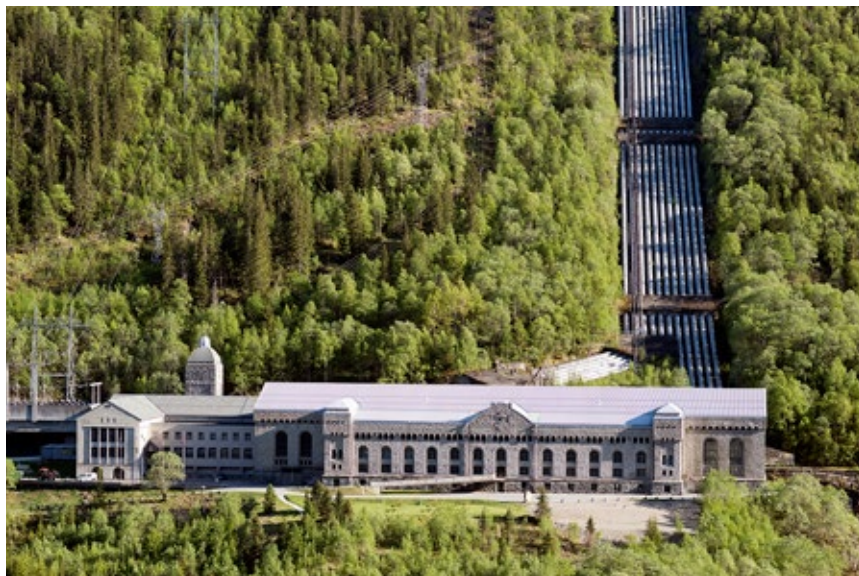
Vemork kraftstasjon var i sin tid verdens største kraftverk.