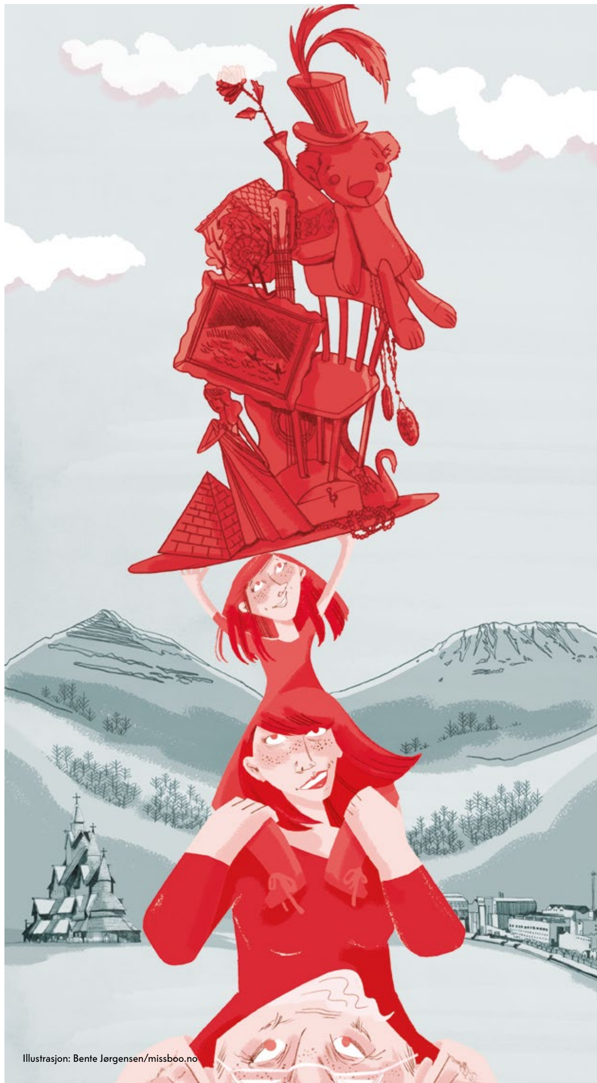
Illustrasjon: Bente Jørgensen/missboo.no