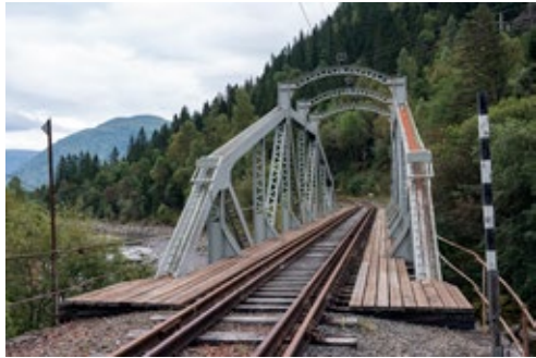
Storemo bru på Tinnosbanen. I alt har strekningen 14 bruer og fem tunneler.