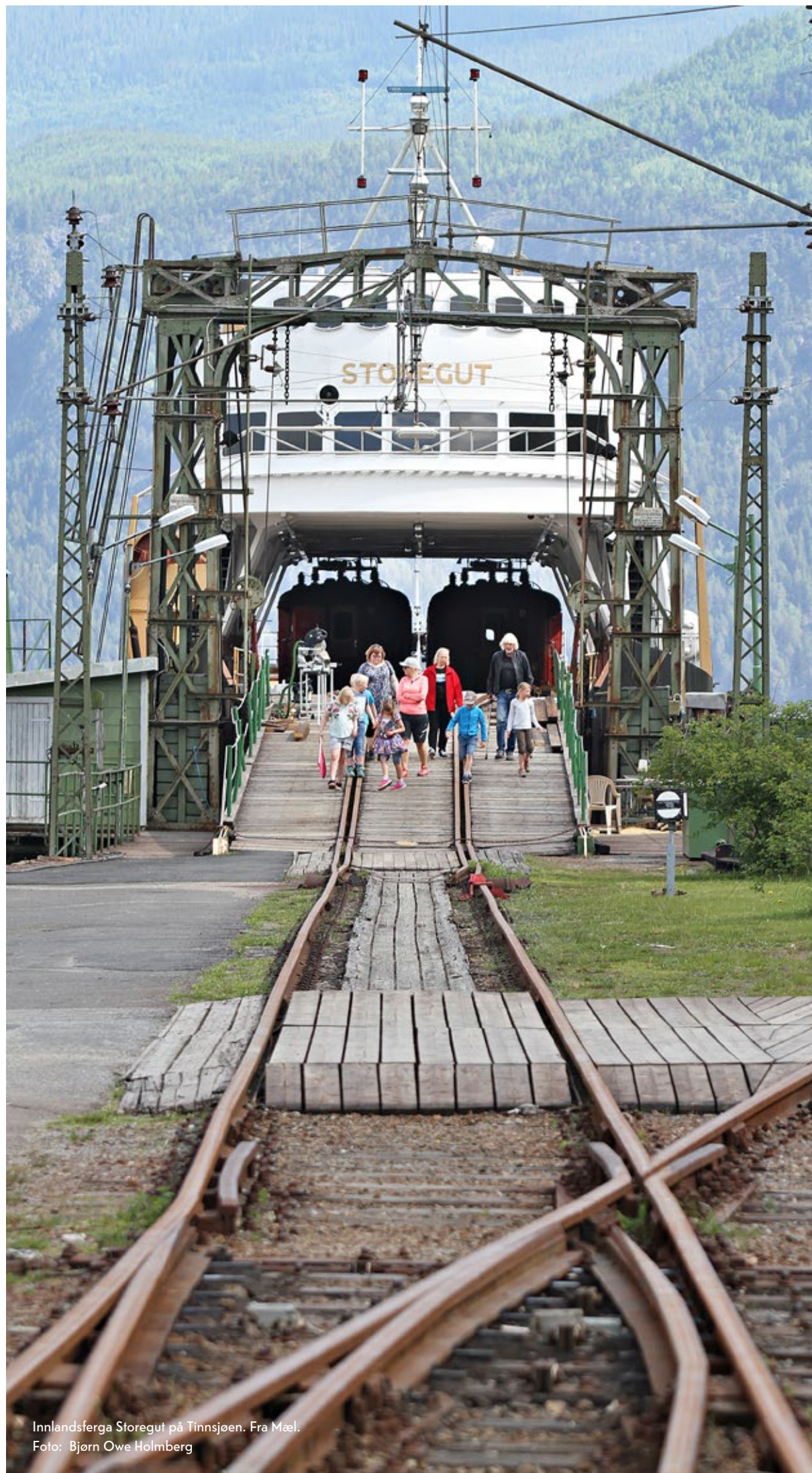
Innlandsferga Storegut på Tinnsjøen. Fra Mæl.