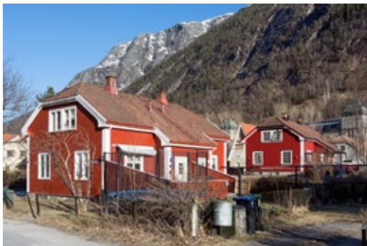
Rødbyen består av åtte tomannsboliger på Rjukan.