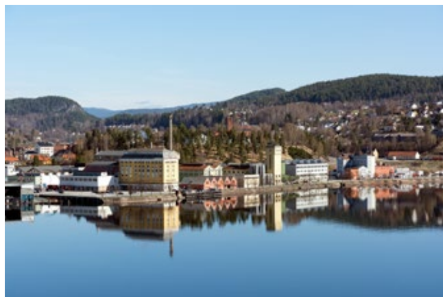
Hydroparken Notodden.