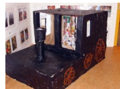
Det er mulig å knytte verdensarven til mange ulike formingsoppgaver. Se mer på industriarven.no