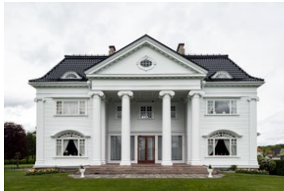
Admini Notodden er tegnet av arkitekt Henning Klouman.