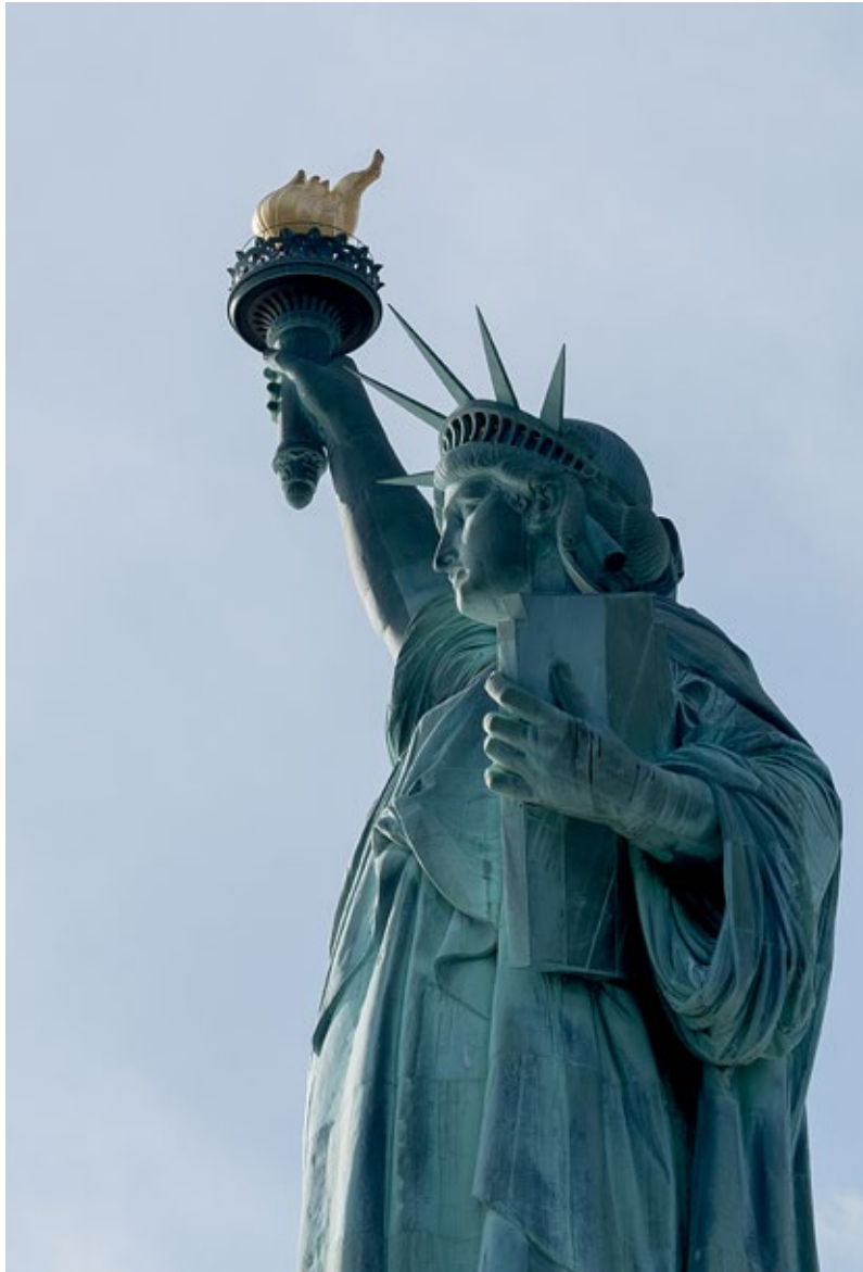
Frihetsgudinnen, New York, USA.