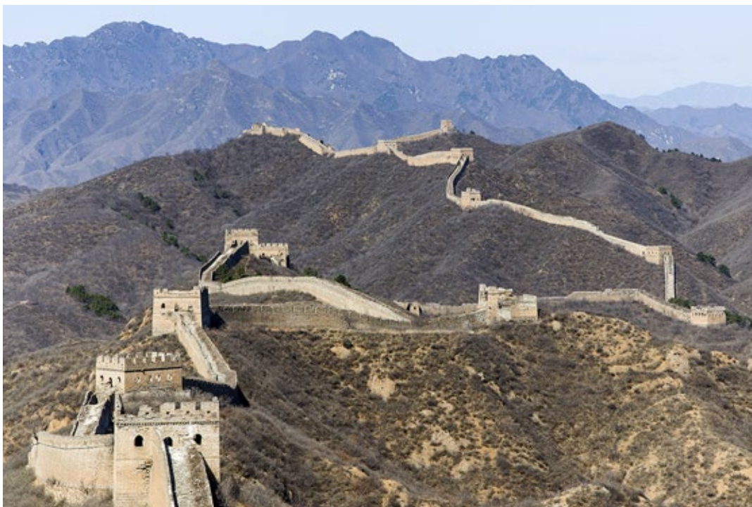
Den kinesiske mur, Kina.

Det er også mulig å laste ned en gratis app som gir informasjon om disse stedene.