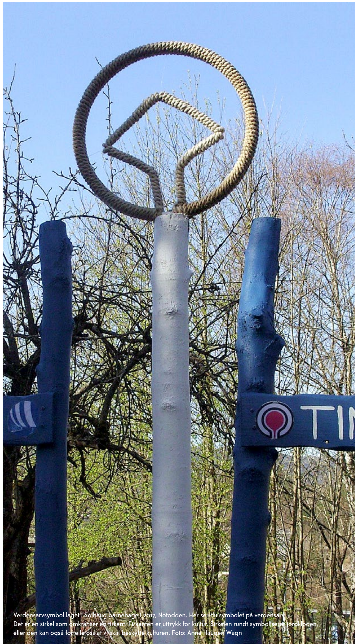
Verdensarvsymbol laget i Solhaug barnehage i 2017, Notodden. Her ser du symbolet på verdensarv. Det er en sirkel som omkranser en firkant. Firkanten er uttrykk for kultur. Sirkelen rundt symboliserer jordkloden, eller den kan også fortelle oss at vi skal beskytte kulturen.