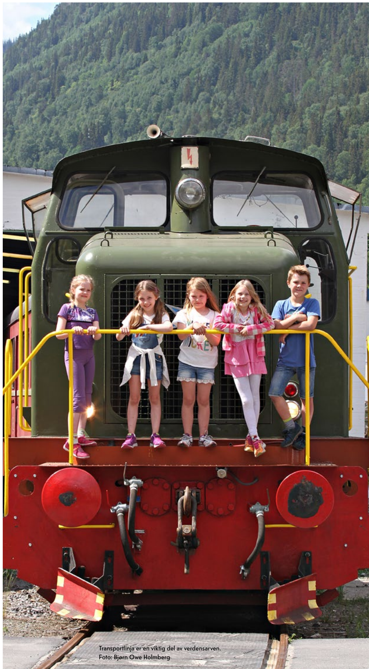
Transportlinja er en viktig del av verdensarven.