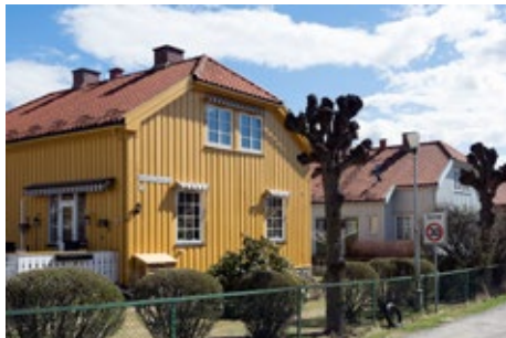
Grønnbyen – Norges første hageby.