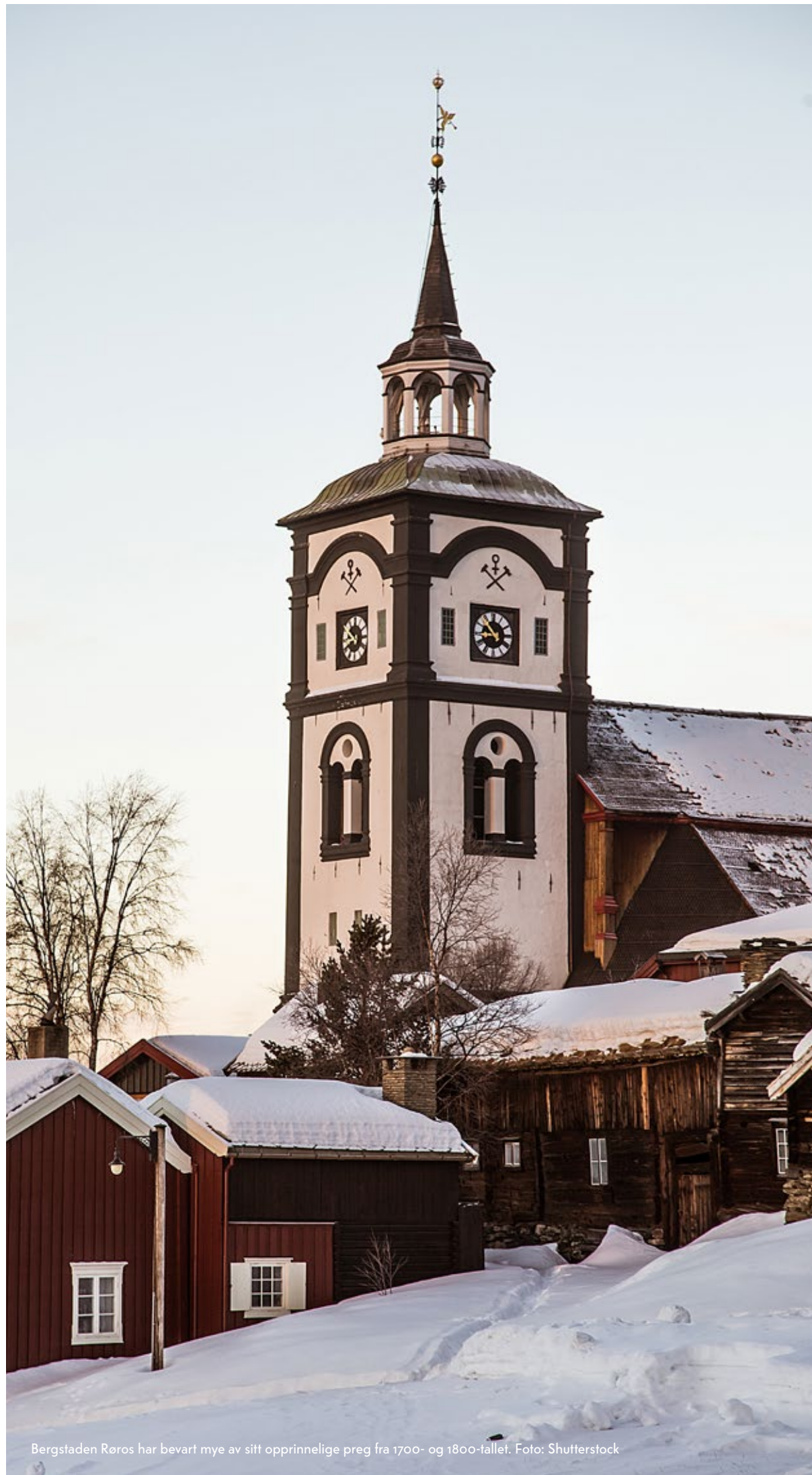
Bergstaden Røros har bevart mye av sitt opprinnelige preg fra 1700- og 1800-tallet.

Røros var et av de første stedene i Norge med status som verdensarv. Hva gjør det med et sted? Erfaring viser at det blir tautrekking mellom konservering og utvikling, fortid og framtid. Men status som verdensarv gir også positive effekter for lokalsamfunnet og regionen. Røros er i dag et viktig turistmål som fører til næringsutvikling og arbeidsplasser.