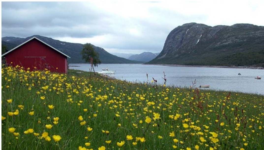
Ved Mogen i mai. Fra 2002.

kone som kom til gards med ei rive og ein sopelime. Der ho bruka riva, var det nokon som overlevde; men der ho sopa med limen strauk alle med.