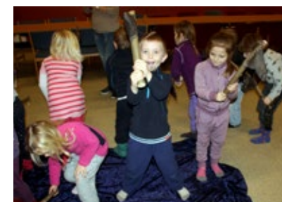
Kattekleiv barnehager arbeider med verdensarv.