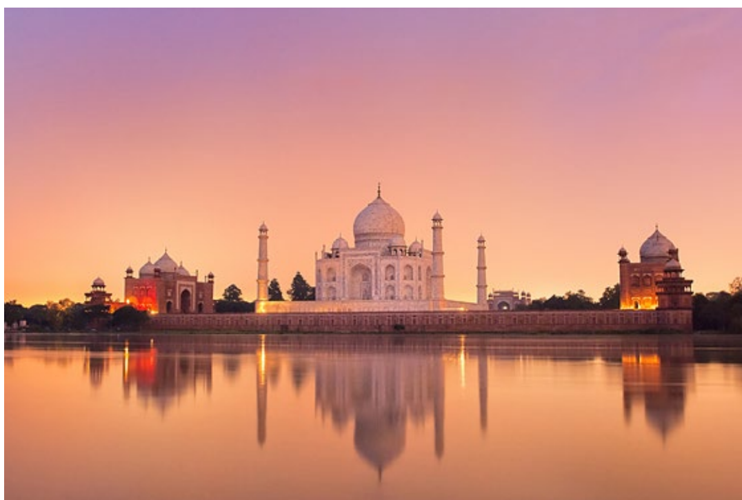
Taj Mahal, India.