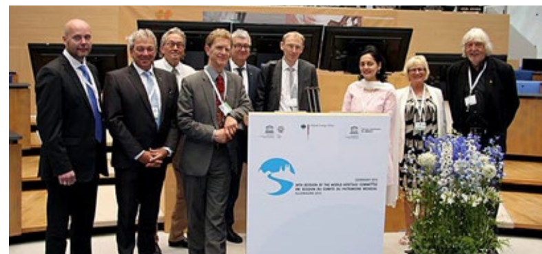
Riksdagen i Bonn 5. juli 2015.