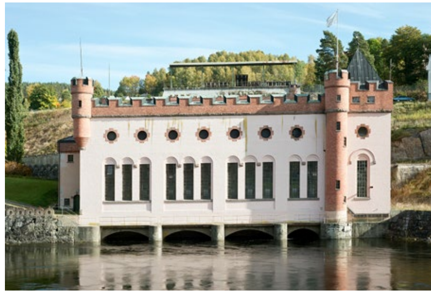
Borgen – Norges flotteste kraftstasjon?