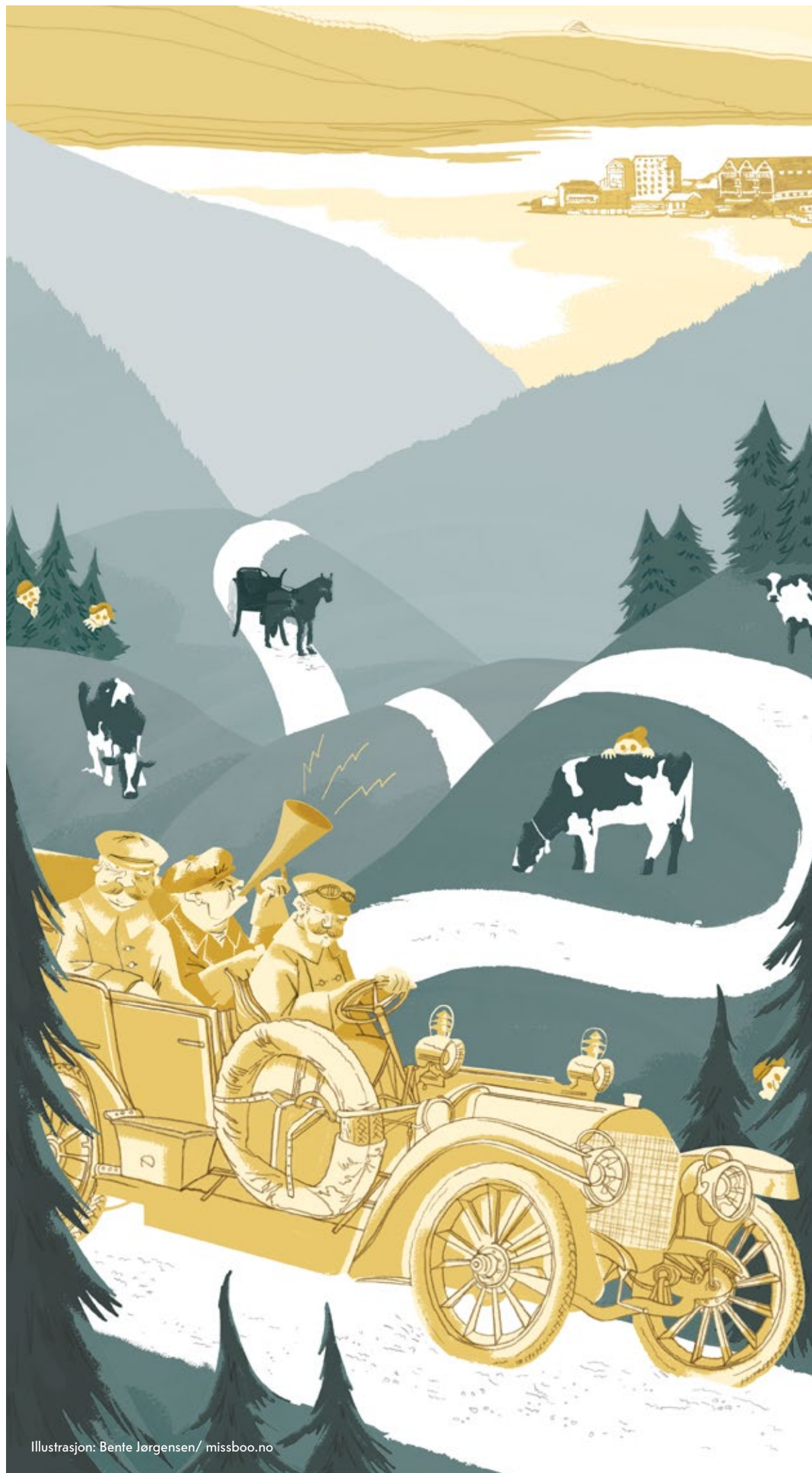
Illustrasjon: Bente Jørgensen/ missboo.no