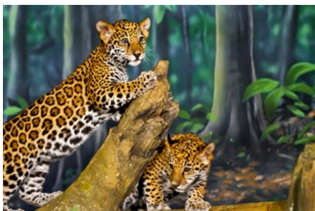
Okavango, Botswana.