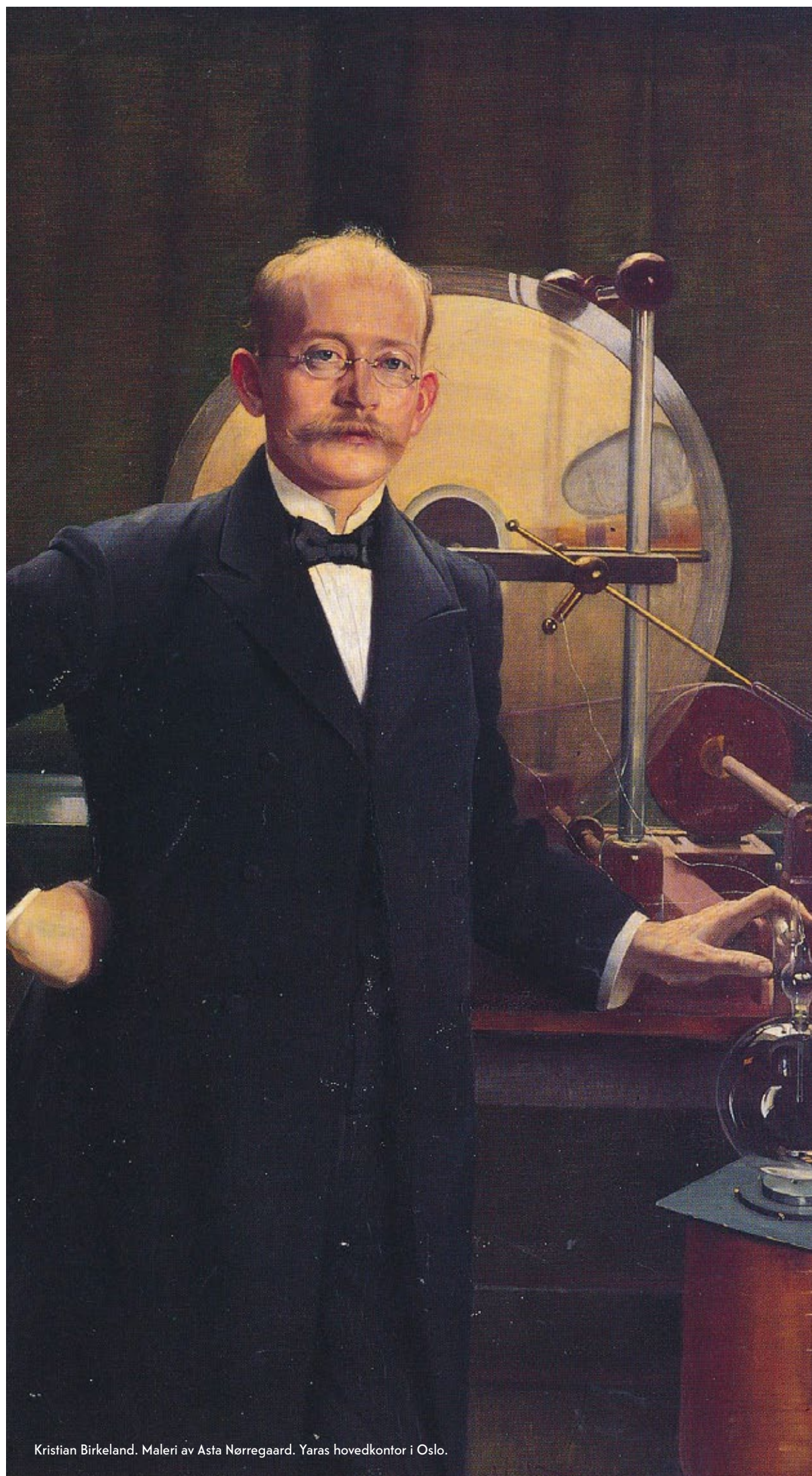
Kristian Birkeland. Maleri av Asta Nørregaard. Yaras hovedkontor i Oslo.