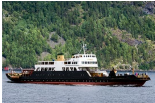
Storegut – det største innlandsfartøyet i Norge.