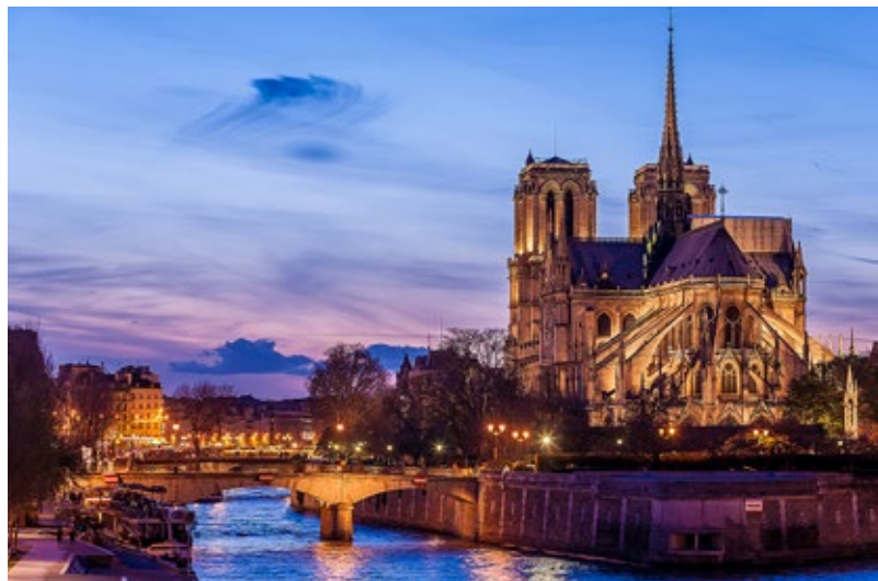
Notre Dame, Paris, Frankrike.