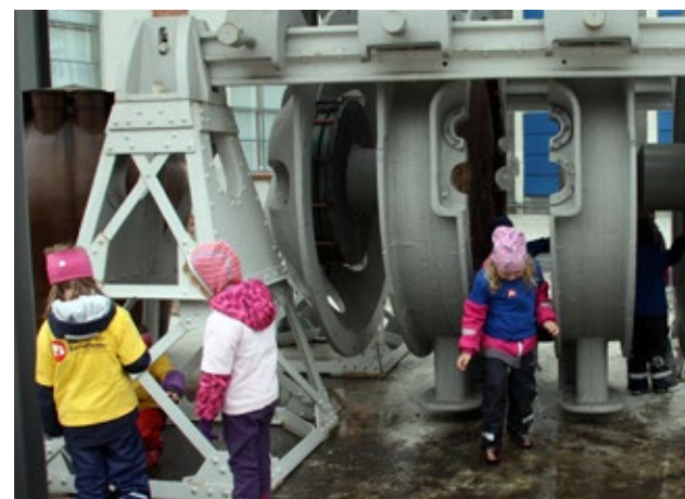
Lysbueovnen. Kattekleiv barnehager på byvandring.