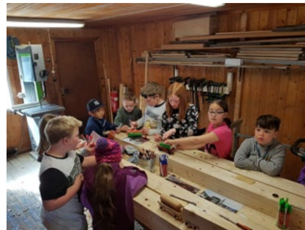
Rjukan barneskole. Elevene har mange aktiviteter knyttet til industriarven.