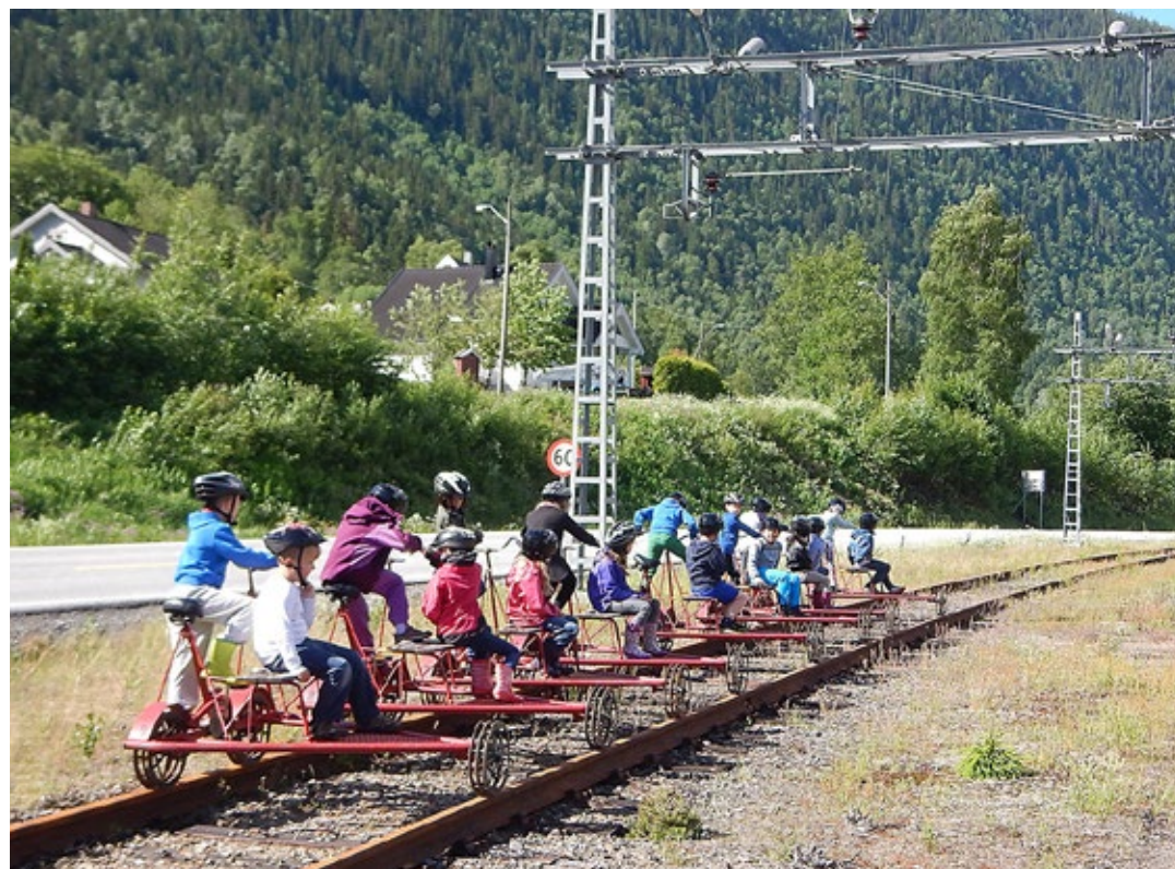
Rjukan barneskole samarbeider tett med DKS (Den kulturelle skolesekken) og NIA ( Norsk Industriarbeidermuseum).