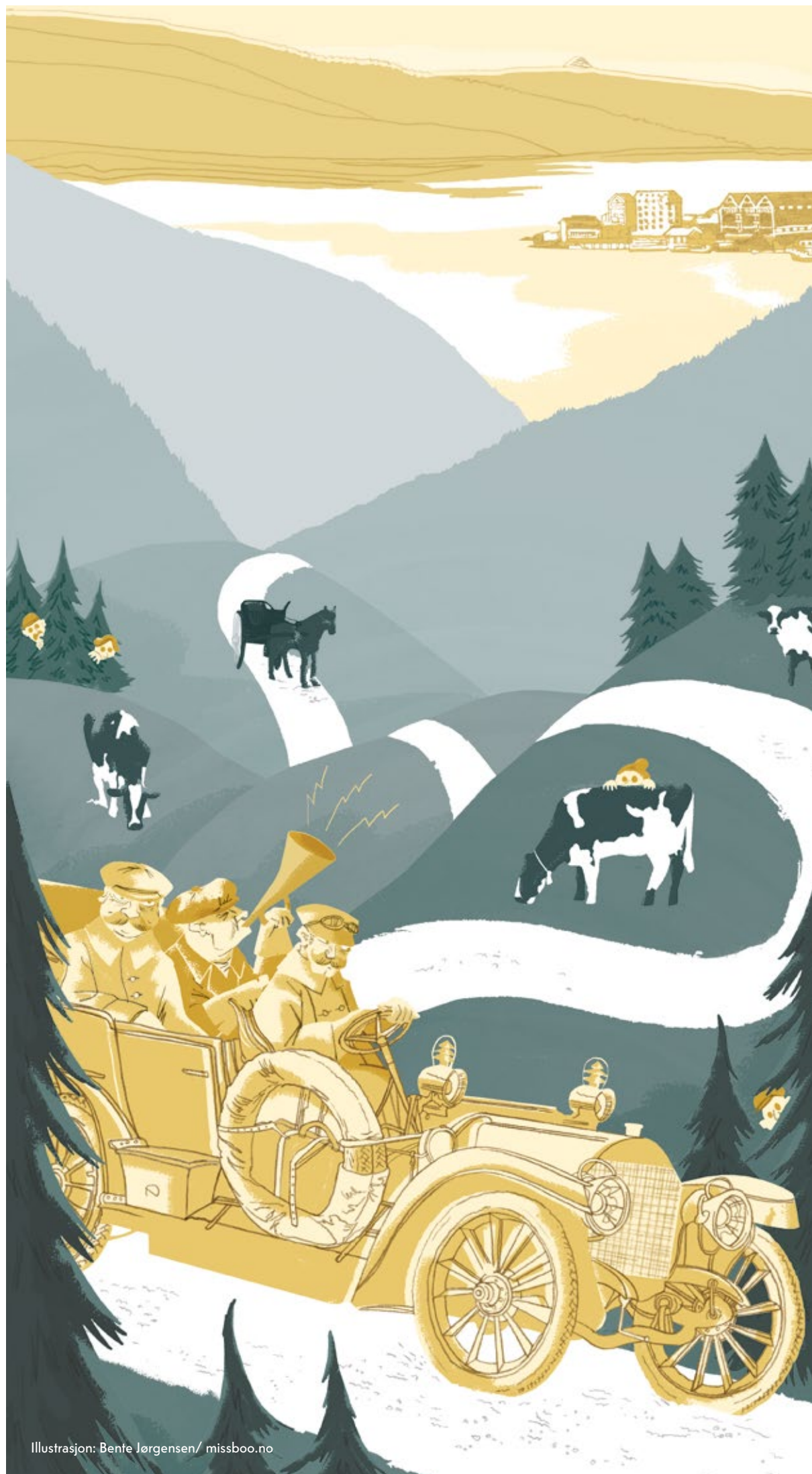
Illustrasjon: Bente Jørgensen/ missboo.no