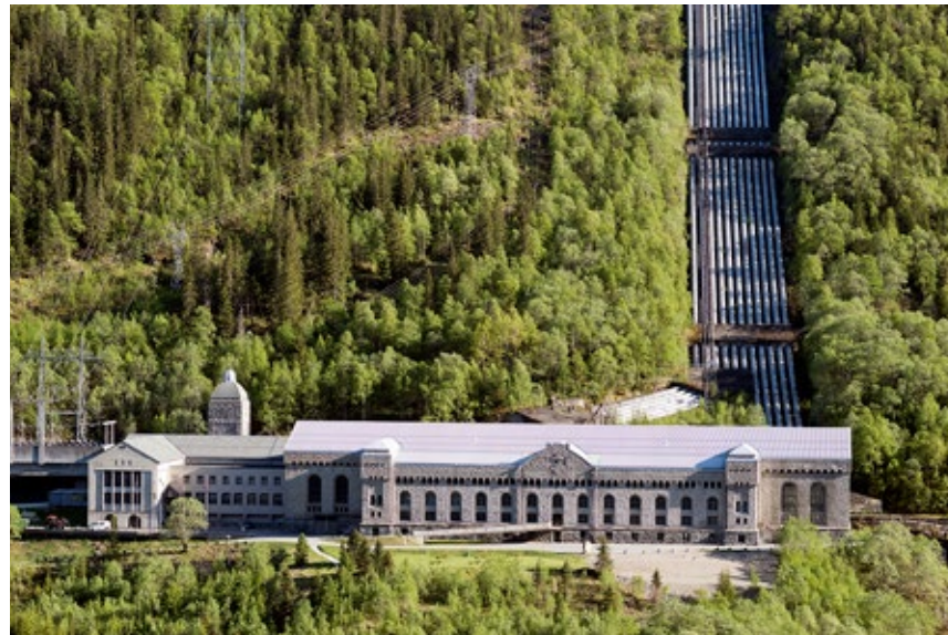
Vemork kraftstasjon var i sin tid verdens største kraftverk.