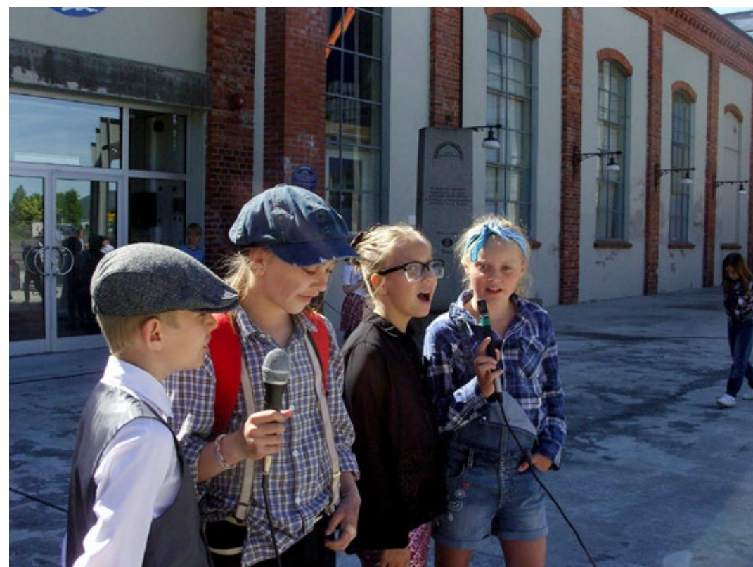
Også i Notodden kommune har det vært samarbeid med DKS om verdensarven. Her fra et musikkprosjekt i Hydroparken Notodden for 4.klasse.