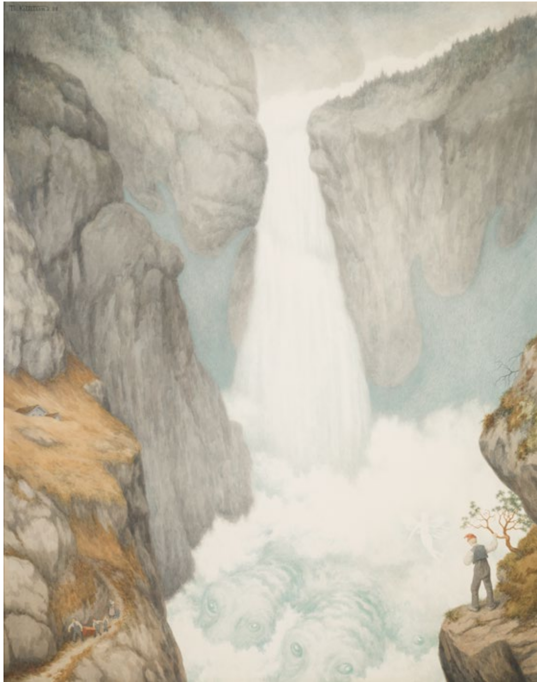
«Fossen». Det første bildet i en serie på fem akvareller. Sam Eyde møtte kritikk. Derfor fikk han Theodor Kittelsen til å lage en serie som framstilte Eyde som helten i industrieventyret. Alle akvarellene finner du i dette heftet og i original på Telemarksgalleriet, Notodden.

På nettsida industriarven.no finner du en utfyllende artikkel om hvorfor og hvordan verdensarven passer godt inn i skolens ulike fagmål.