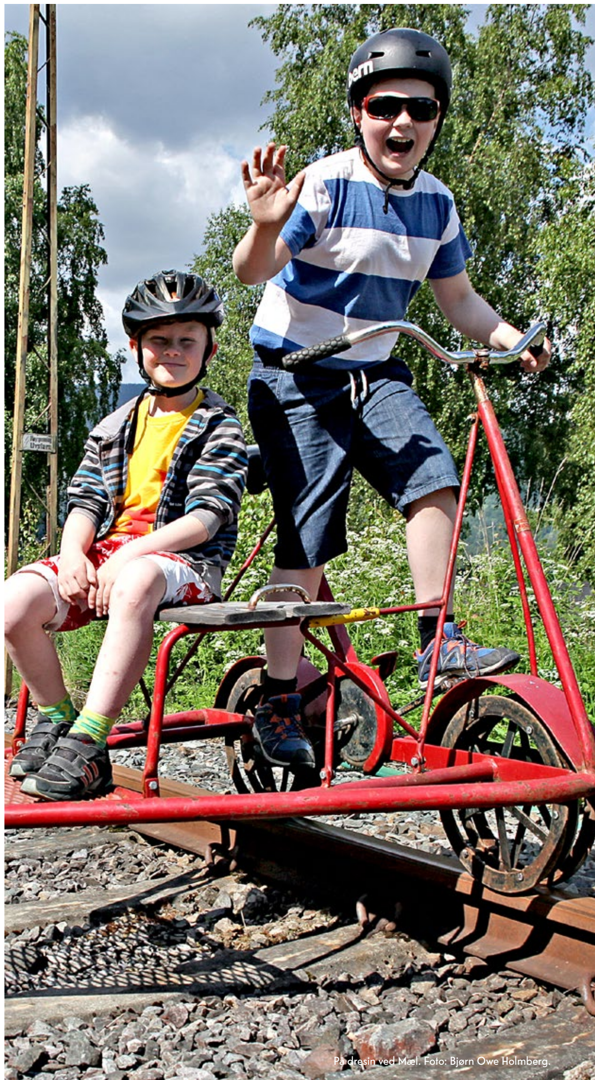
På dresin ved Mæl.