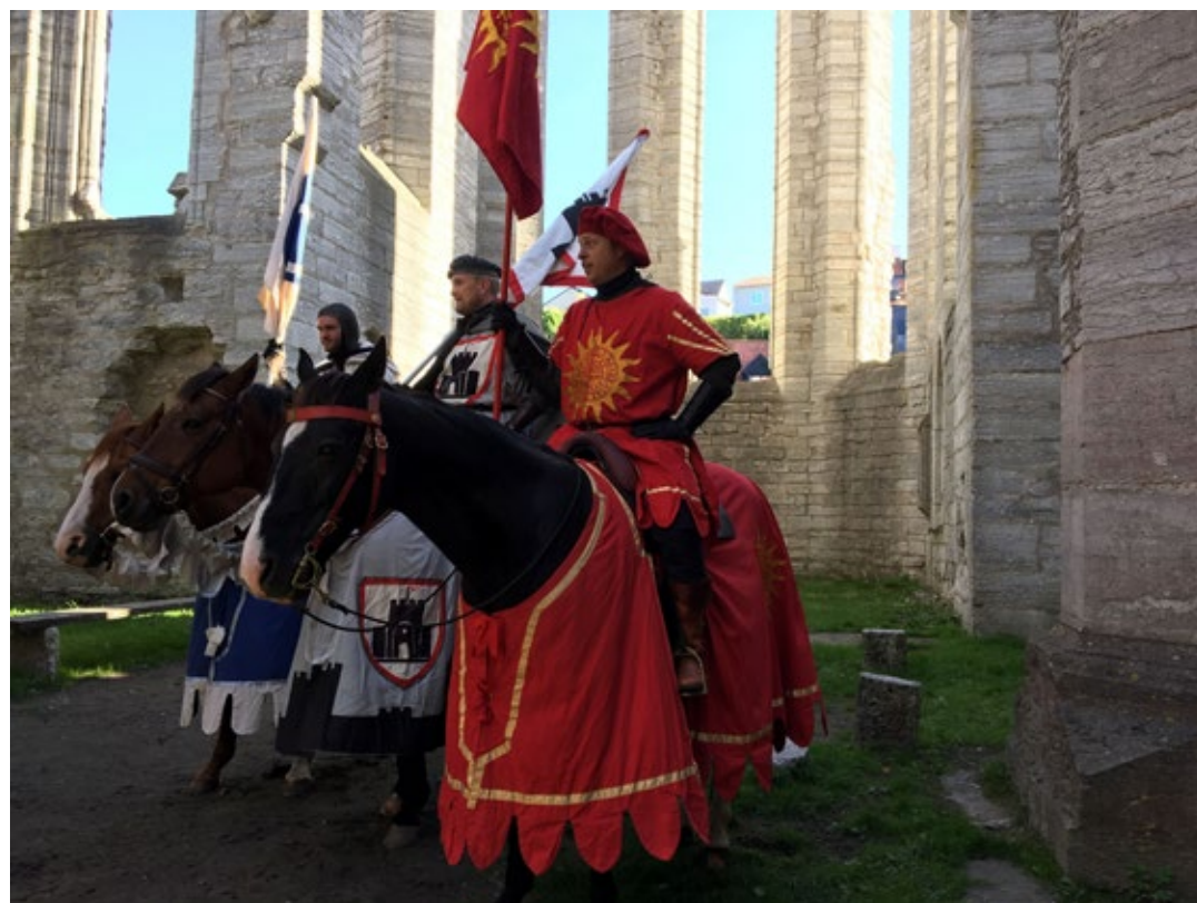
Visby er først og fremst kjent for sine bygninger fra middelalder. Mange aktiviteter knytter seg derfor til denne tidsperioden.

1. oktober hvert år arrangerer kommunen Visby på Gotland i Sverige en verdensarvdag for barnehager og skoler. Den kombineres med et større arrangement som kalles Visbydagen. Denne dagen og noen dager forut deltar barn og unge på Gotland i ulike arrangement som knyttes til temaet verdensarv. Oppleggene har forbindelser til middelalderbyen Visby, som fikk status som verdensarvsted i 1995.